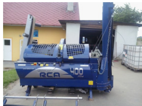
Štípač dříví pořízený z minulého dotačního období.